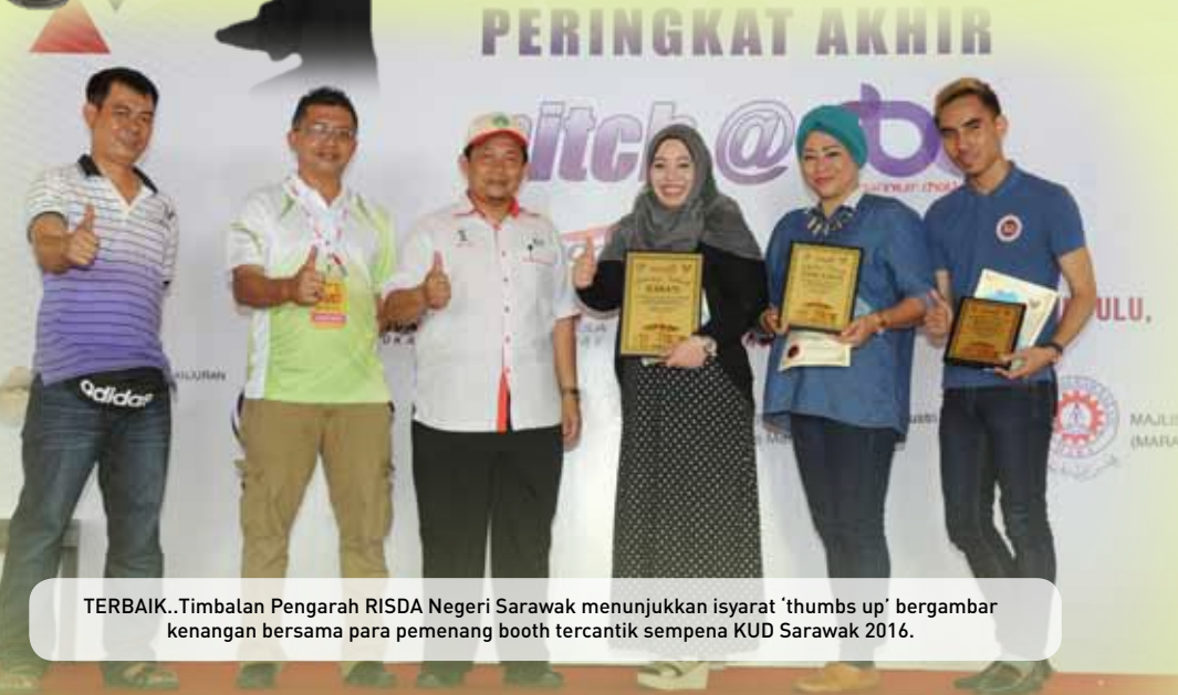
TERBAIK.. Timbalan Pengarah RISDA Negeri Sarawak menunjukkan isyarat 'thumbs up' bergambar kenangan bersama para pemenang booth tercantik sempena KUD Sarawak 2016.