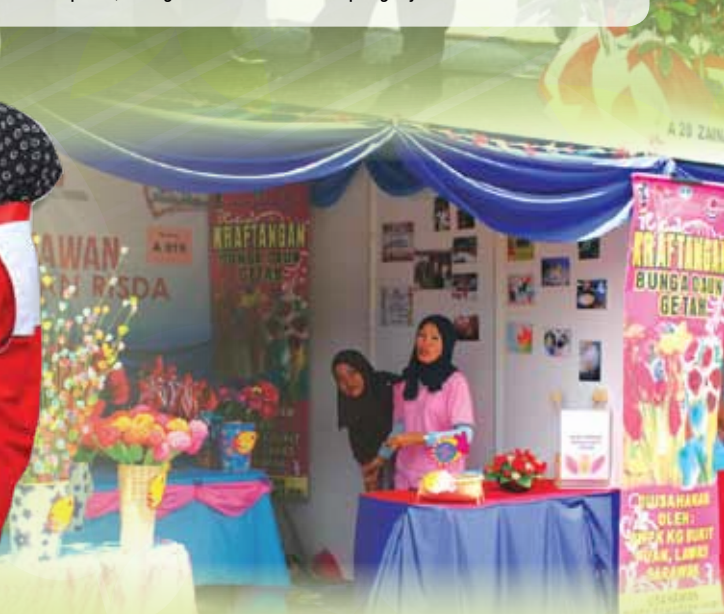
DEKAT DI HATI.. Kraf Bunga Daun Getah tidak dapat dipisahkan dengan Usahawan Bimbingan RISDA antara yang dijual di KUD Sarawak 2016.