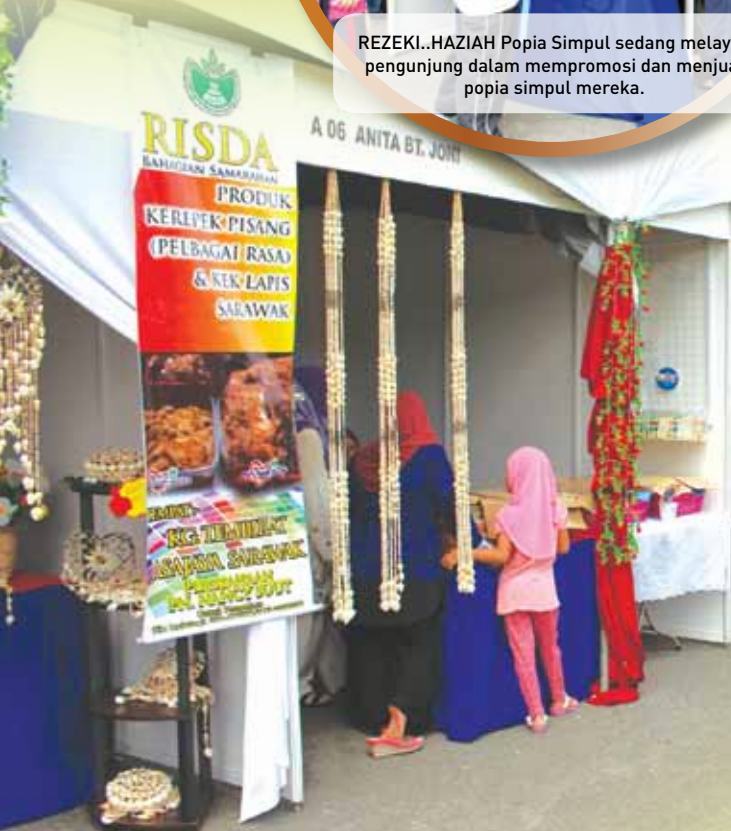
SIAP..Deretan Booth Usahawan Bimbingan RISDA yang menempatkan seramai 21 orang usahawan bersedia menerima kunjungan orang ramai.