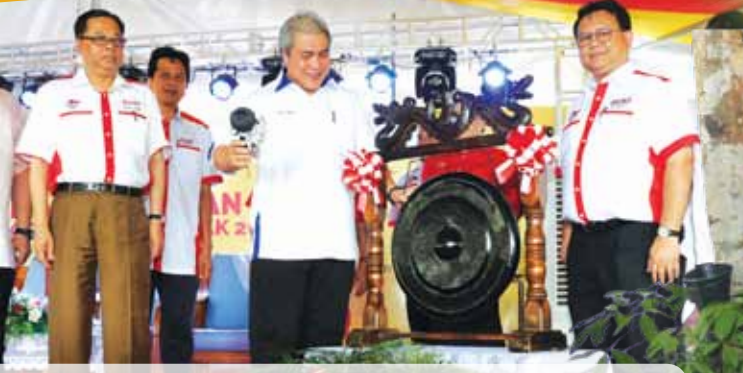
Yang di-Pertua Dewan Undangan Sarawak menandakan perasmian Mini KUD Sarawak 2016 yang disempurnakan oleh Datuk Amar Haji Awang Tengah Bin Ali Hasan Menteri Muda Sarawak diiringi oleh Menteri Besar Sarawak, Datuk Seri Ismail Sabri Bin Yaakob Menteri Kemajuan Luar Bandar & Wilayah bersama Menteri Kanan Sarawak, Datuk Alexander Nanta Linggi Timbalan Menteri Kemajuan Luar Bandar & Wilayah.