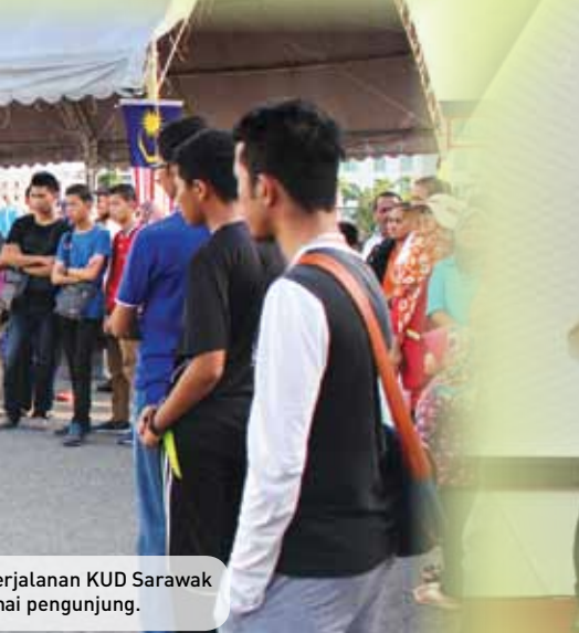
Perjalanan KUD Sarawak menarik perhatian pengunjung.