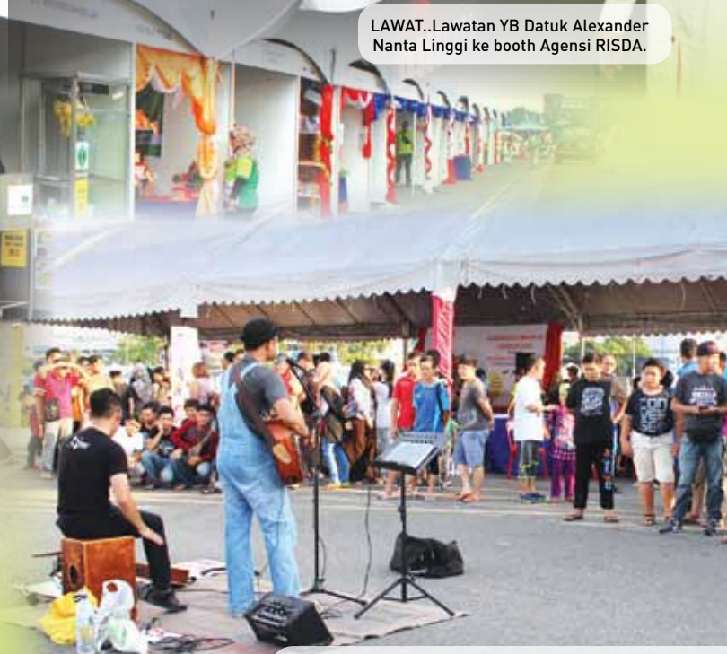
TARIKAN... Persembahan buskers tempatan mengiringi pe 2016 dengan alunan lagu yang terkini menarik ram