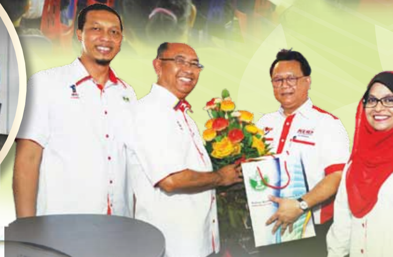
LAWAT..Lawatan YB Datuk Alexander Nanta Linggi ke booth Agensi RISDA.