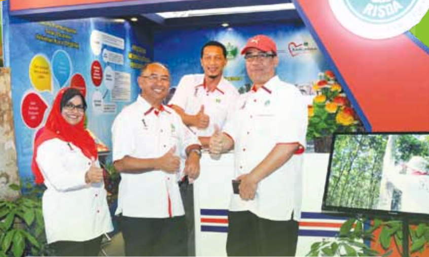
BERUSAHA.. Ketua Pengarah RISDA bersama Pengarah RISDA Sarawak, Pengarah Bahagian Pembangunan Usahawan dan Timbalan Pengarah Bahagian Komunikasi Korporat, orang kuat di sebalik tabir penganjuran KUD Sarawak 2016.