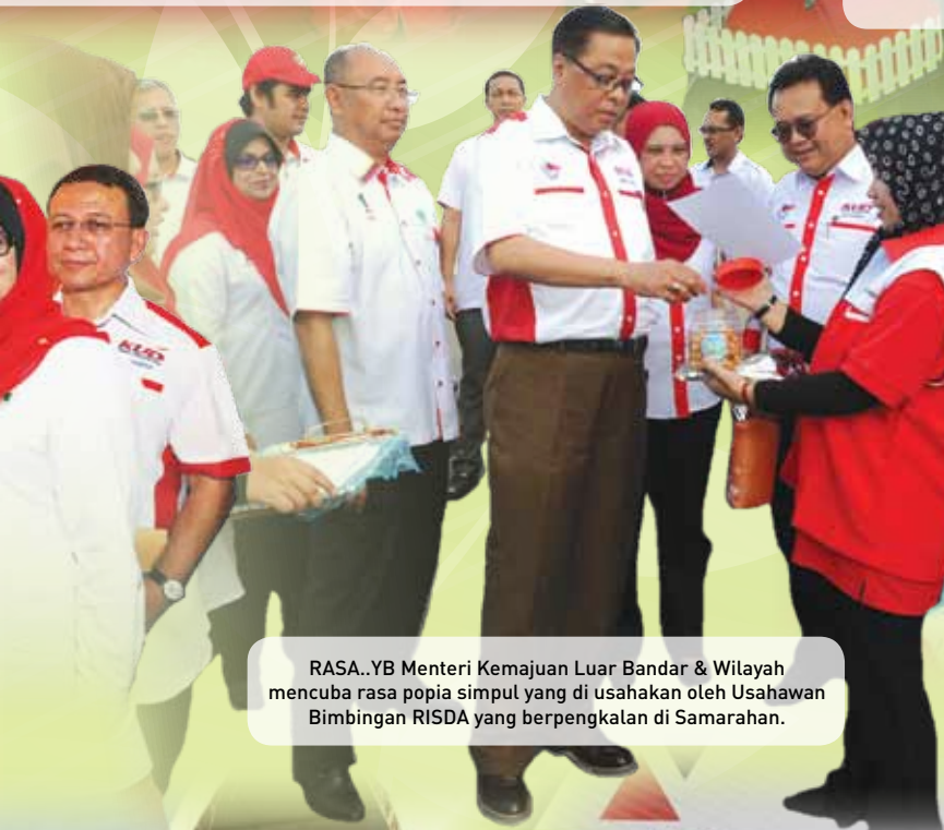
RASA.. YB Menteri Kemajuan Luar Bandar & Wilayah mencuba rasa popia simpul yang di usahakan oleh Usahawan Bimbingan RISDA yang berpangkalan di Samarahan.