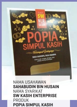
NAMA USAHAWAN SAHABUDIN BIN HUSAIN NAMA SYARIKAT SW KASIH ENTERPRISE PRODUK POPIA SIMPUL KASIH