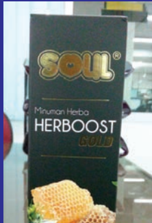
NAMA USAHAWAN NOR IDAWATI BINTI MAT ISA NAMA SYARIKAT PROFIT MAKMUR ENTERPRISE PRODUK HERBOOST 250ML